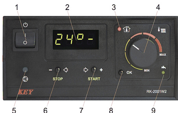
Rysunek 1. Widok płyty czołowej regulatora RK-2001W2N.

Podstawowa obsługa regulatora polega na ustawieniu gąlką termostatu wymaganej temperatury, pozostałe funkcje regulator realizuje zgodnie z zaprogramowanymi w trybie serwisowym parametrami. Zmiana ustawienia termostatu wskazywana jest przez kilka sekund na wyświetlaczu np. [C 55] i oznacza wartość temperatury wody w kotle, do której będzie dążył regulator. Chwilowe sprawdzenie tej wartości możliwe jest też po krótkim naciśnięciu przycisku OK.